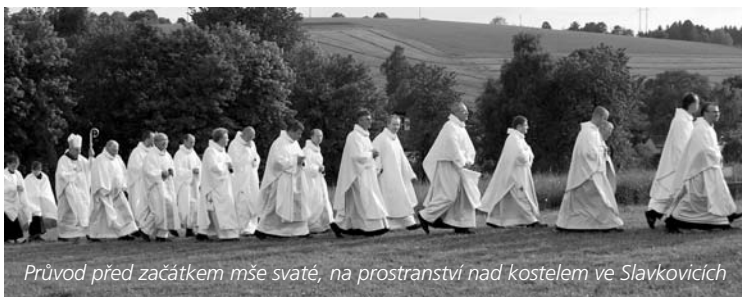
Průvod před začátkem mše svaté, na prostranství nad kostelem ve Slavkovicích