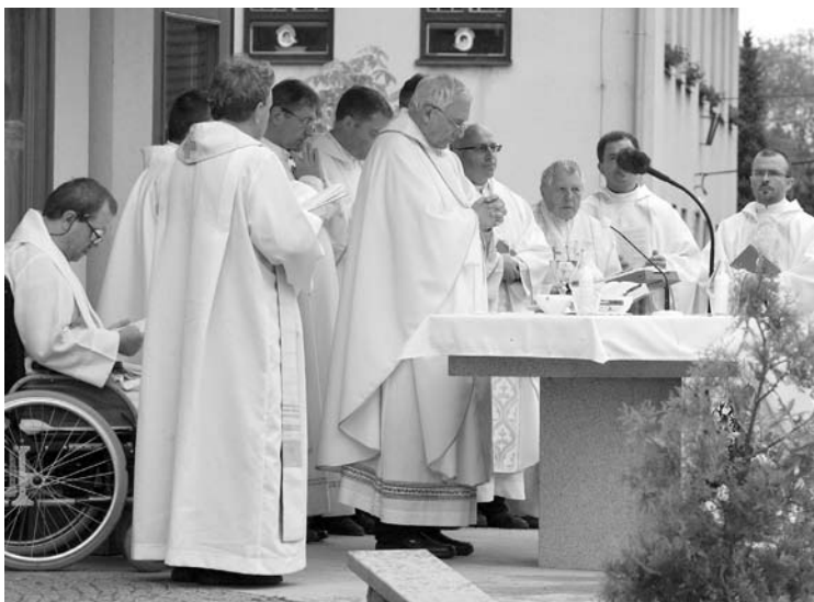
V pátek 20. května v 18.30 hodin začala mše svatá na zahájení kongresu, kterou sloužil Mons. Jiří Mikulášek, generální vikář brněnské diecéze

Od 22 hodin se v kostele ve Slavkovicích konala po celou noc adorace za dobré plody kongresu