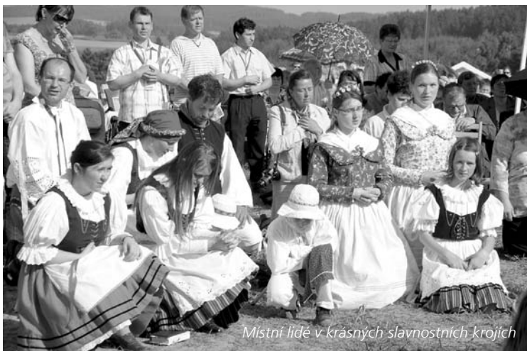
Místní lidé v krásných slavnostních krojích

A proto jinak, zcela a v hloubi můžeme a musíme i my s velkou naléhavostí v situacích naší doby říci: Přijď, Pane! Přijď, jak to ty chceš a znáš. Přijď tam, kde je bezpráví a násilí. Přijď do uprchlických táborů Dárfúru, severního Kivu, do mnoha částí světa. Přijď tam, kde vládnu drogy. Přijď i mezi ty boháče, kteří na tebe zapomněli a kteří žijí jen sami pro sebe. Přijď i do našich srdcí, přijď a obnov náš život, přijď do našeho srdce, abychom se my sami mohli stát světlem Boha, Tvou přítomností. V tomto smyslu se modleme se svatým Pavlem: „ Marana, tha! – Přijď, Pane Ježíši!“. Modleme se, aby Kristus byl skutečně přítomen dnes v našem světě a aby jej obnovil.“