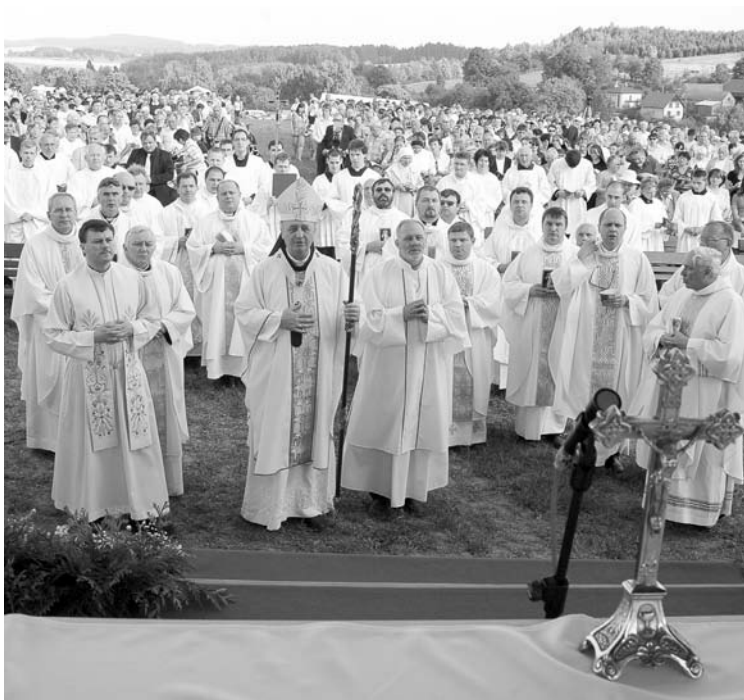
Po modlitbě zasvěcení Božímu milosrdenství zaznělo slavnostní „Te Deum“