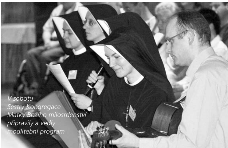
V sobotu Sestry Kongregace Matky Božího milosrdenství připravily a vedly modlitební program