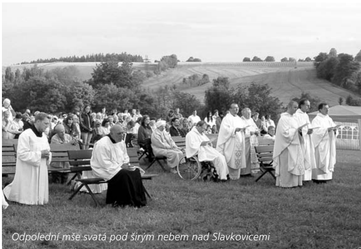
Odpolední mše svatá pod širým nebem nad Slavkovicemi

Přístupme tedy směle k trůnu milosti, abychom došli milosrdenství a našli milost a pomoc v pravý čas.