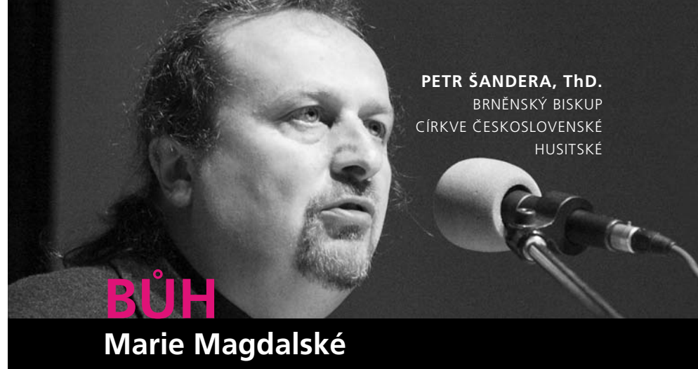
PETR ŠANDERA, ThD. BRNĚNSKÝ BISKUP CÍRKVE ČESKOSLOVENSKÉ HUSITSKÉ