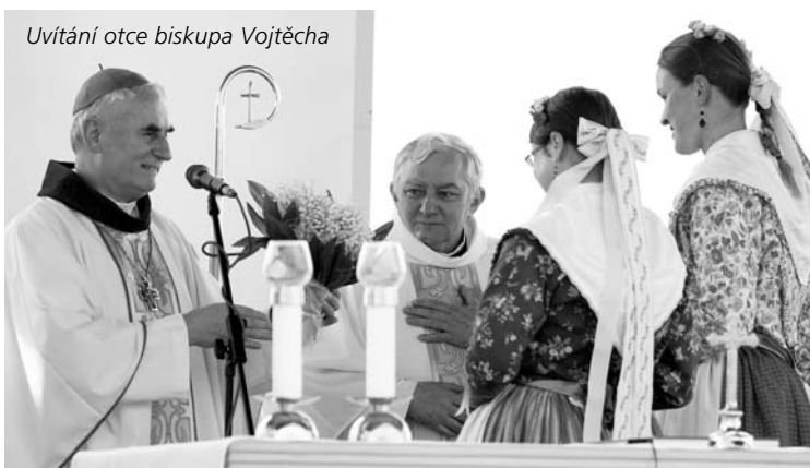
Uvítání otce biskupa Vojtěcha