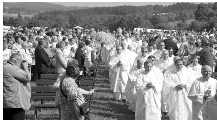
V neděli v 16 hod. začala mše svatá spojená se zasvěcením Božím milosrdenství