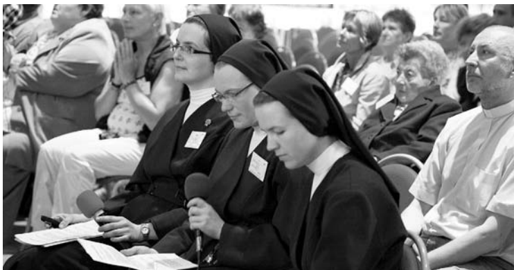
Nedělní program začaly sestry Vincentky ranní modlitbou