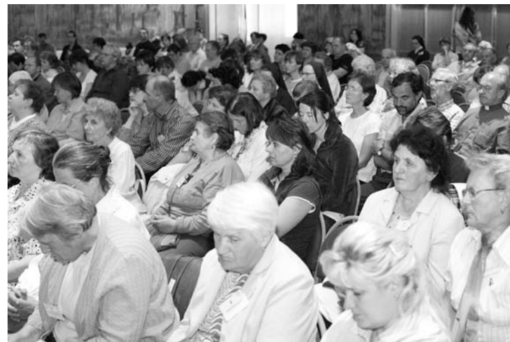
Přednášky a program kongresu probíhaly v kulturním domě v Novém Městě na Moravě

ALE TI, KDO TUTO ŠANCI UCHOPÍ, TAK MOHOU ZAŽÍT V OBROVSKÉ SÍLE LÁSKU BOŽÍ. Mohl bych tady říct ten citát, je to trošku ve smyslu evangelia, ale není to přímo citát: KOMU BYLO MNOHO ODPUŠTĚNO, TEN MNOHO MILUJE (srov. L 10, 47). Právě lidé, kteří toto s Pánem zažili, tak mohou velmi dobře dosvědčit Boží milosrdenství. Protože pro ně to není prázdný pojem, který si najdou v nějakém teologickém slovníku. Pro ně je to přímá zkušenost, pro ně je to opravdová síla, kterou zakusili ve svém životě! Vždyť jsme to zažili! Vždyť ta Boží láska způsobila to, co se zdálo nemožné. Ubohou existenci, trosku, řekli bychom, proměnila nejenom ve